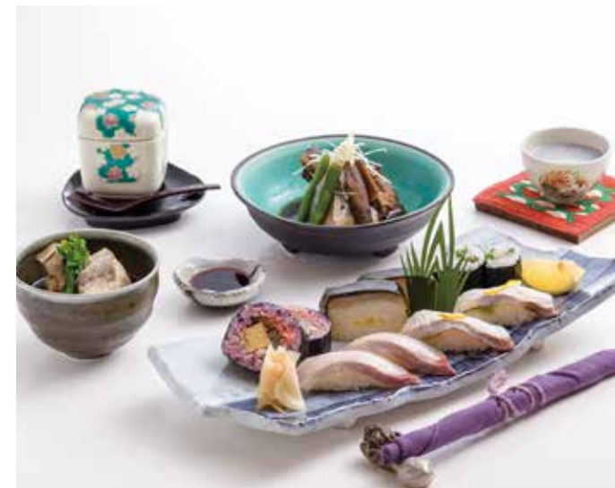
かのやかんぱち「寿司ご膳」2,808円(税込) ※要予約

かごしまさかなブランド認定「かのやかんぱち」を「地の利」であるとびっきりの新鮮さをコンセプトに「寿司技術」を活かした、様々なかのやかんぱちの味わいを贅沢に盛り込みました。2014年大隅食のおみやげ最優秀賞受賞の「かのや名産 かんぱち箱寿司」は日本全国ここでしか味わえない自慢の一品です。