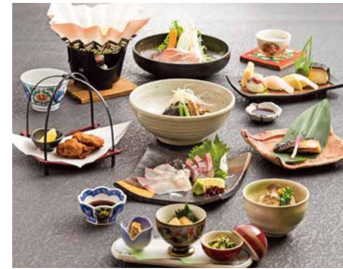
かのやかんぱち「黒潮ご膳」4,104円(税込) ※要予約

鹿屋市共栄町16-7(JR鹿児島中央駅より直行バスで120分 垂水港から車で40分 鹿児島空港より直行バスで200分 鹿屋市役所前バス停より徒歩3分) ☎0994-42-4402 11時30分～14時、17時30分～22時 月曜定休(祝日の場合は翌日)/P有(15台)