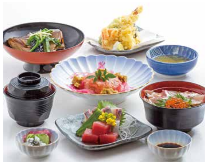
カンパチ御膳 2,000円(税込) ※要予約

黄金カンパチを美味しく食せる料理方法を思索した中で完成させた一品。「冷製トマトのカンパチ山葵和え」を料理の中央に配置し、カンパチ漬丼、あら煮、刺身盛り等で彩りも鮮やかに仕上げました。また、皮部分も独自の調理法により驚きの食感を体験できます。