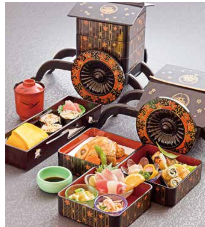
大隅かんぱちめぐり 2,800円(税込) ※要予約

鹿屋市共栄町16-7(JR鹿児島中央駅より直行バスで120分 垂水港から車で40分 鹿児島空港より直行バスで200分 鹿屋市役所前バス停より徒歩3分) ☎0994-42-4402 11時30分～14時、17時30分～22時 月曜定休(祝日の場合は翌日)/P有(15台)