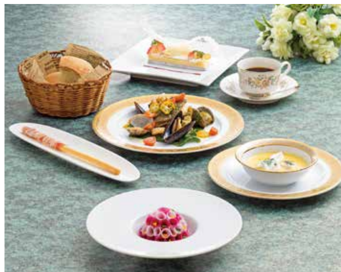
カンパチのフルコース 8,000円(税込) ※要予約

垂水は、カンパチの出荷量、日本一でございます。「地の利」を活かし、とれたての新鮮なカンパチをフレンチ風にアレンジいたしました。【生で】【焼いて】【蒸して】…それぞれの部位に合わせた調理法で。存分にお楽しみくださいませ。