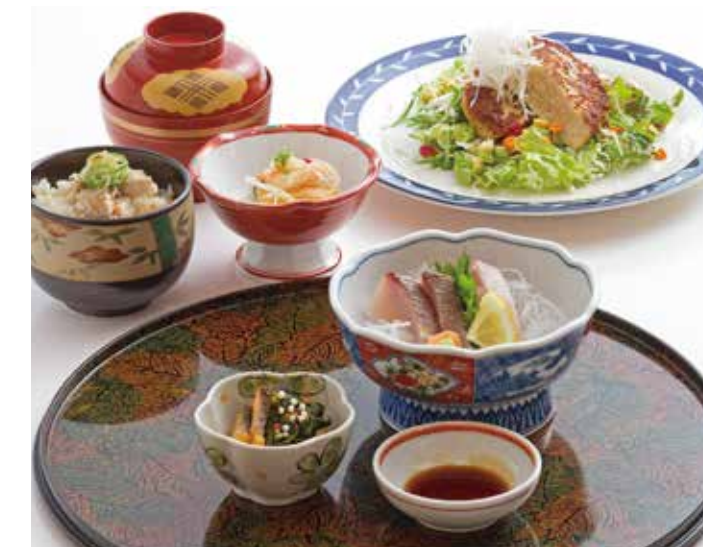
カンバーグ膳 1,500円(税込) ※要予約

鹿屋市吾平町麓2973 (垂水港から車で約1時間30分 鹿屋市から約20分) ☎0994-34-4500 11時30分～14時OS、17時30分～20時30分OS 毎月第2月曜定休/P 有