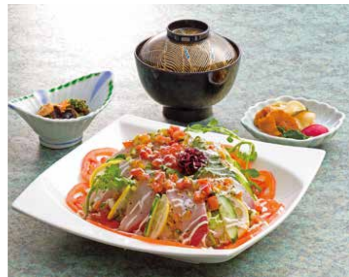
カンパチ カルパッチョ丼 1,200円(税込) ※要予約

刺身とサラダとお寿司が一緒になった丼ぶり。オリジナルソースが味の決め手!! ヘルシーなので女性に人気です!