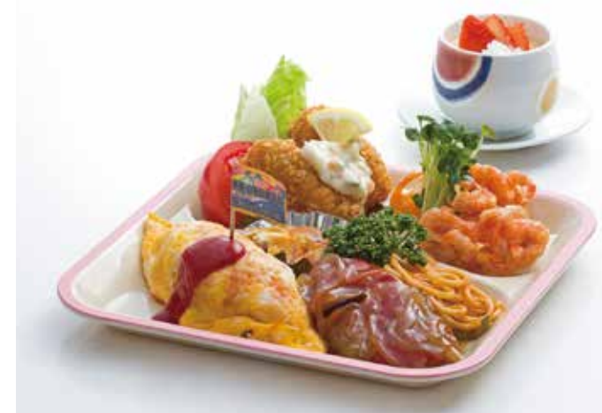
かんぱちお子様ランチ 500円(税込)

かのやカンパチを大人だけでなく、お子様にもカンパチの美味しさを知ってもらいたく、カンパチをふんだんに使いました。