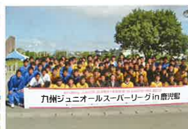
九州ジュニアオールスターリーグin鹿児島