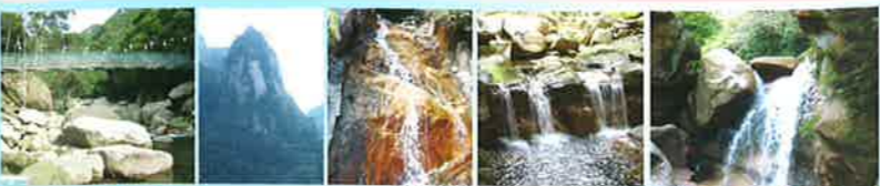
鉄山吊橋 刀剣山 平蔵の滝 三姉妹滝

●所在地/垂水市中俣 4066-27 ●営業時間/AM8:30 ~ PM5:00