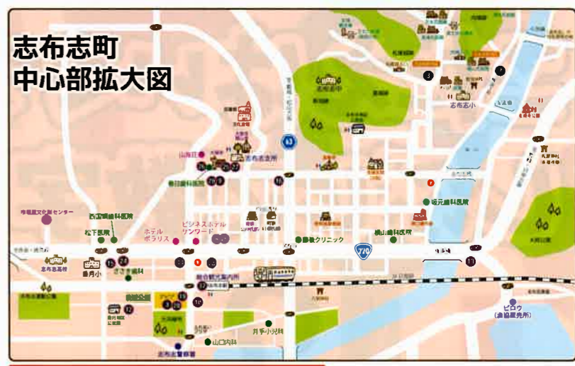
★…問題設置場所 ◆…抽選応募箱設置場所