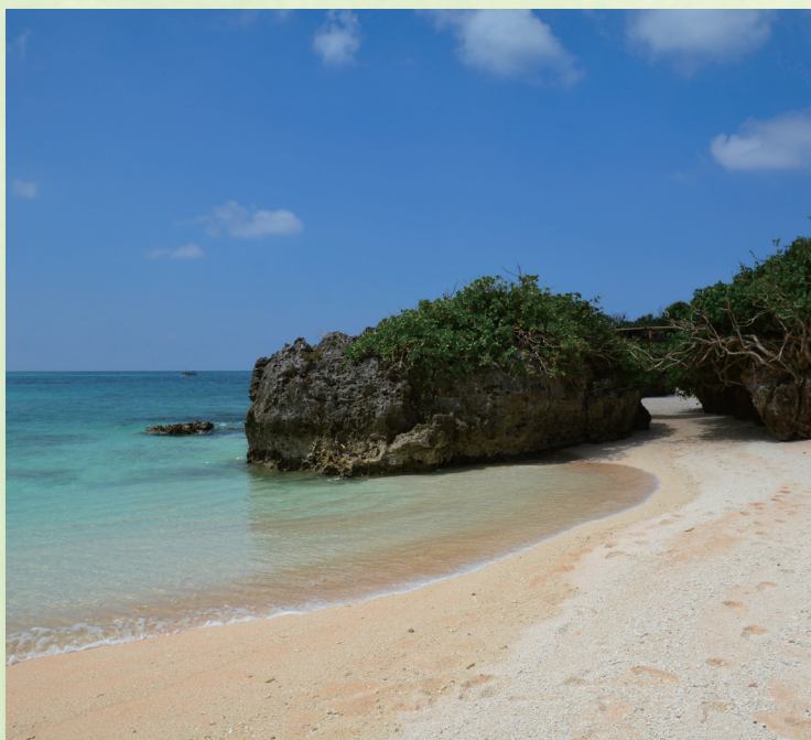
大賞「与論町の海岸」(海謝美)