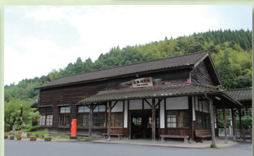
優秀賞「大隅横川駅」(大隅横川駅保存活用実行委員会)