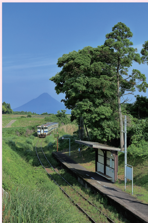
大賞「JR指宿枕崎線開聞岳を望める駅、松ヶ浦駅」(松ヶ浦自治会)