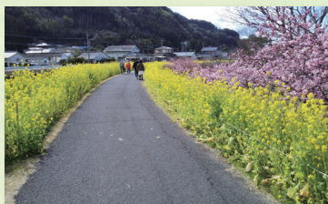
優秀賞「日木山川菜の花ロード」(福永建設(株))