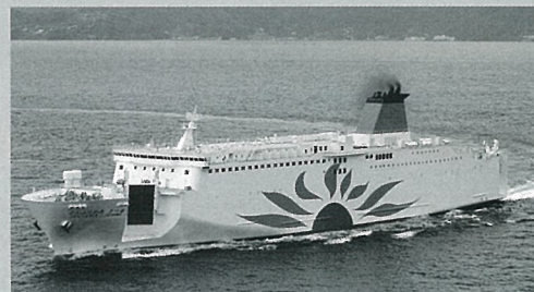
就航船舶 さんふらわあ さつま (総トン数13,659ト 全長192m 巾27.0m)